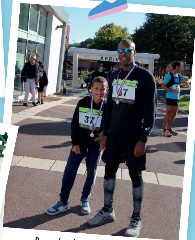
Parents et enfants courent pour les Parcours du cœur.