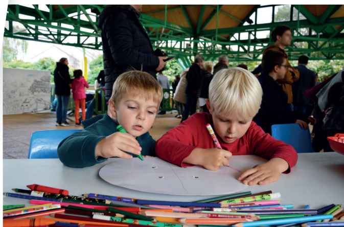
Les plus jeunes laissent parler leur créativité lors d'ateliers.