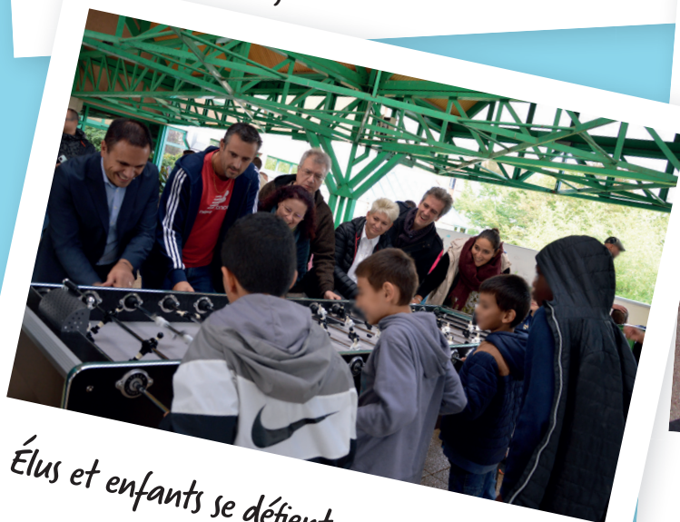
Élus et enfants se défient au baby-foot XXL.