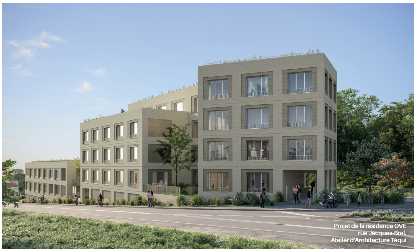
Projet de la résidence OVE rue Jacques-Brel. Atelier d'Architecture Téqui