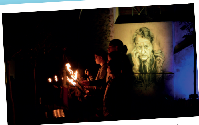
Le Conseil Municipal des Jeunes porte les flambeaux à l'inauguration de la place André-Malraux.