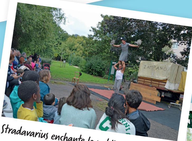
Stradavarius enchante le public.

Le temps d'un week-end, la ville a vibré au rythme des traditionnelles fêtes de la Saint-Côme et Saint-Damien. Vendredi 23 septembre, les Villebonnais sont venus partager une paëlla avant de danser sur les musiques entraînantes du groupe Alkabaya. Stands de cow-boy, ateliers créatifs, mur d'escalade... Samedi, les familles ont profité d'animations sur la place de l'Hôtel de Ville. Sur les bords de l'Yvette, la poésie du spectacle Stradavarius a enchanté le public. Après l'inauguration émouvante de la place André-Malraux, la soirée s'est terminée dans la fête avec un programme Cloclo et disco. Dimanche matin, place aux sportifs ! La course familiale a rassemblé de nombreux duos parent-enfant venus courir pour les parcours du cœur de la Fédération Française de cardiologie. Pour conclure le week-end en beauté, les Négresses Vertes ont mis le feu au Centre Culturel Jacques-Brel.