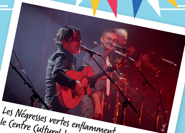
Les Négresses vertes enflamment le Centre Culturel Jacques-Brel.