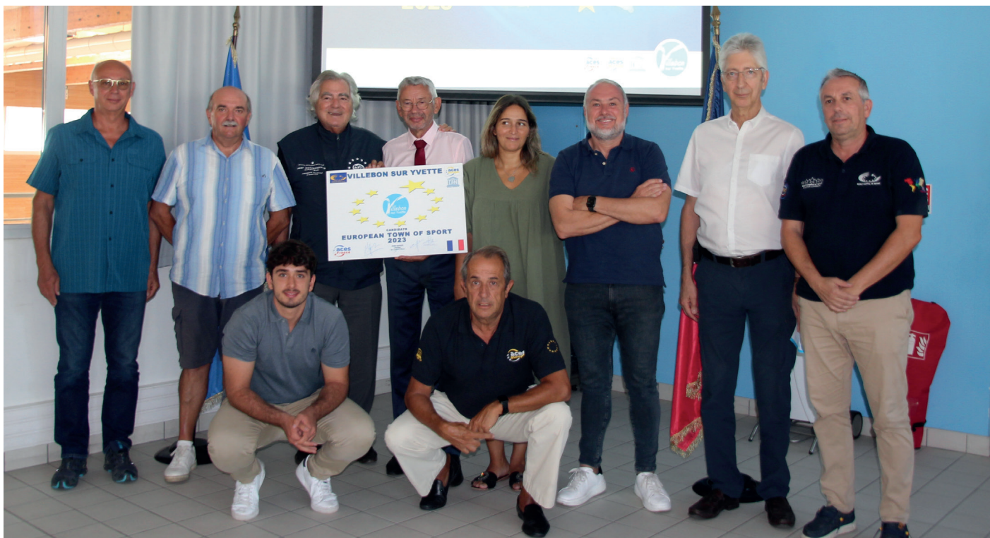
Jeu 25 août : Villebon-sur-Yvette reçoit une délégation de l'ACES Europe pour présenter sa candidature au label Ville Européenne du Sport.

Retrouvez le compte rendu complet et l'ensemble des délibérations du Conseil municipal sur le site de la Ville, rubrique Kiosque/ Affichage administratif.