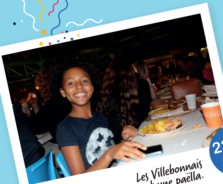
Les Villebonnais partagent une paëlla.